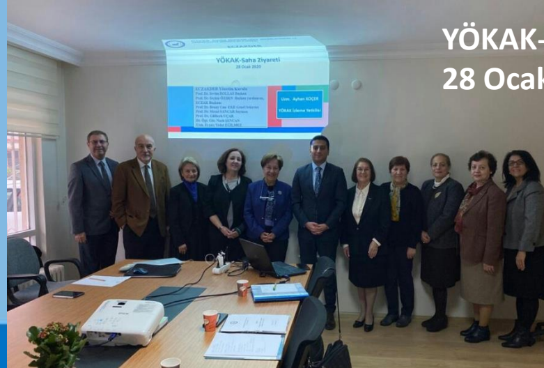
YÖKAK-Saha Ziyareti 28 Ocak 2020