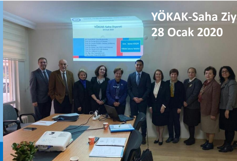
YÖKAK-Saha Ziyareti 28 Ocak 2020