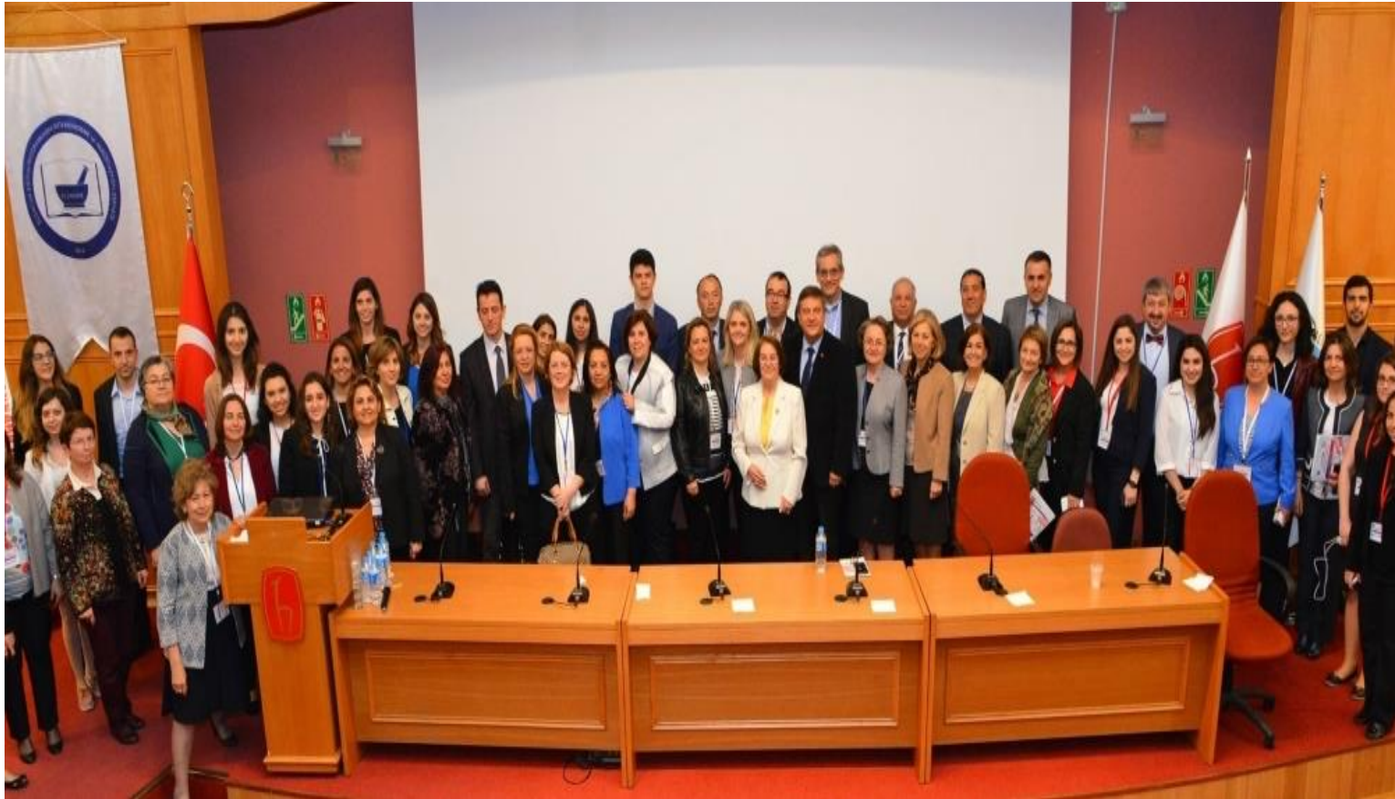
Ulusal Eczacılık Eğitimi ve Akreditasyon Kongresi, 2016-Ankara

Eğitimin kalitesini gösteren en önemli kriterlerin başında akreditasyon gelmektedir.