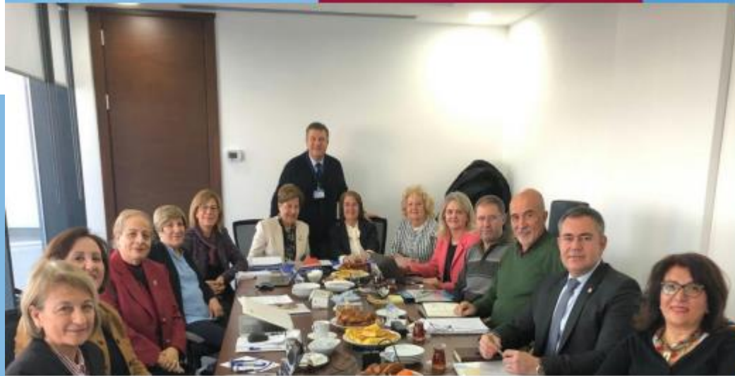
ECZAK toplantısı, 2019 Ankara