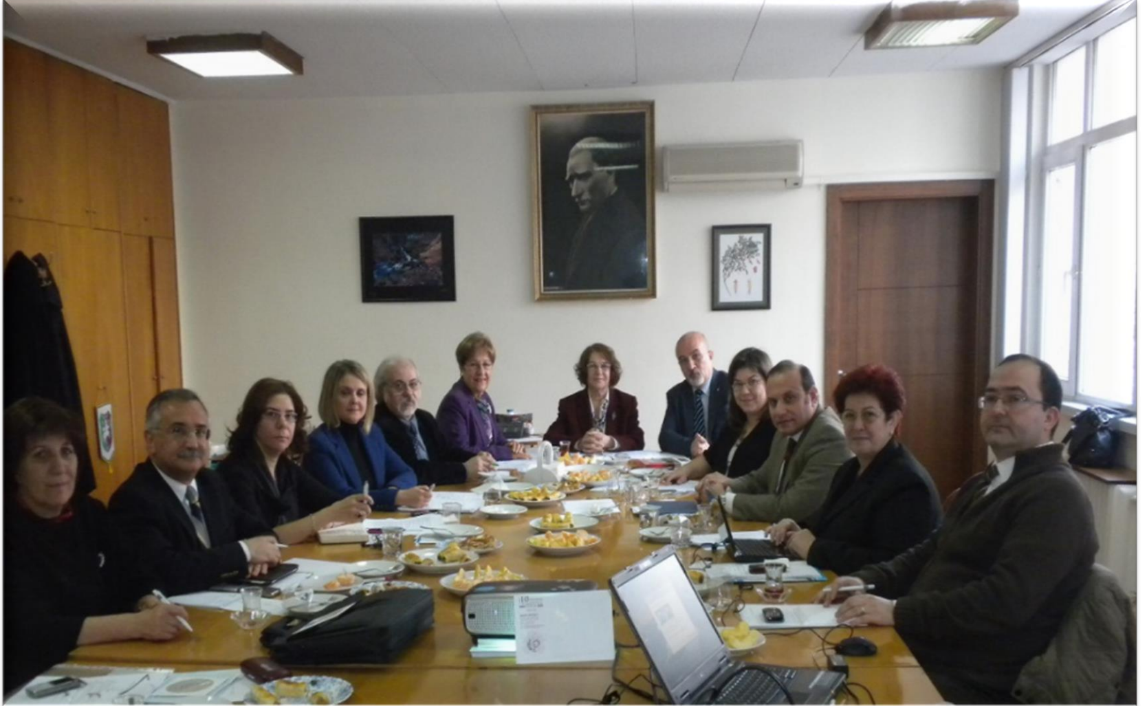
ECZAK'ın ilk toplantısı, 6 Ocak 2012-Ankara